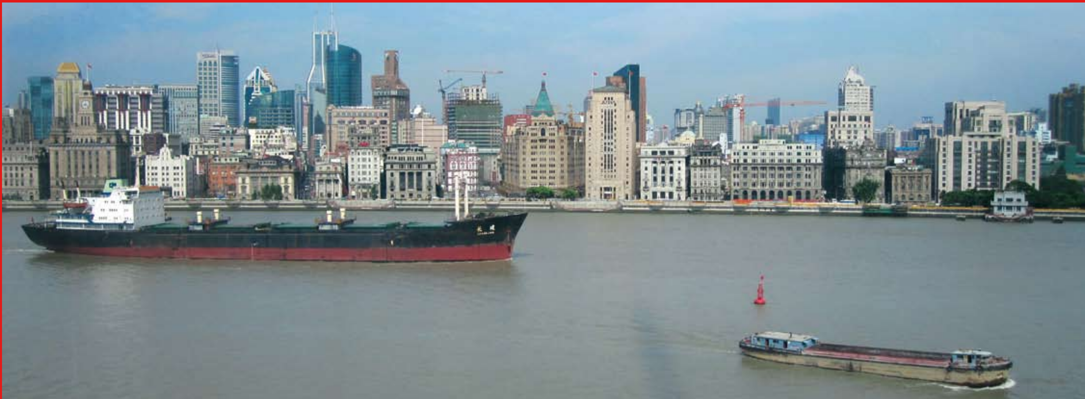
Shanghai gilt als das wirtschaftliche Zentrum und Boomtown Chinas. Mit 14 Mio. Einwohnern ist sie die zweitgrößte Stadt nach Chongqing. Der Name Shanghai bedeutet übersetzt „über dem Meer“. (Shang = über, Hai = Meer). Shanghai is regarded as the economic centre and boomtown of China. After Chongqing, it is the second largest city with 14 billion inhabitants. The literal translation of the name Shanghai means “over the see”. (Shang = over, Hai = sea).