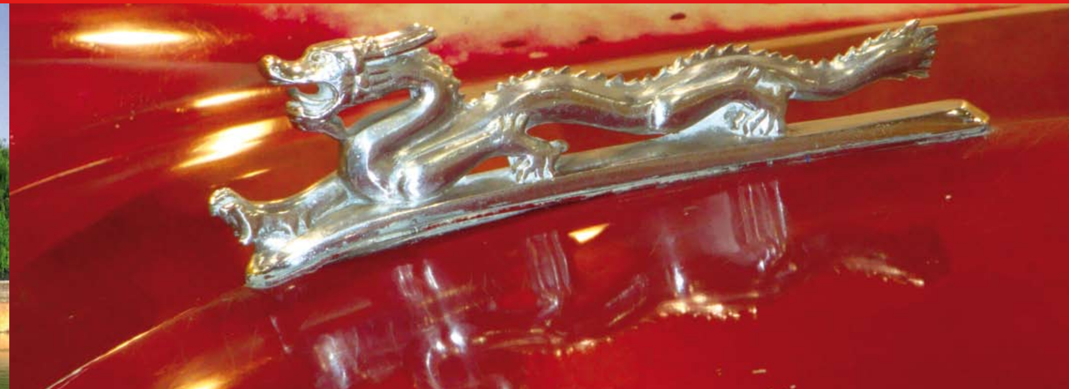
Chinesische Drachen sind Glücksbringer und ein Zeichen für Friedfertigkeit. Drachen symbolisieren ein langes Leben und Glück. Foto: Kühlerfigur des ersten in China gebauten Automobils. The Chinese dragons are lucky charms and symbolize peacefulness. Dragons represent long life and luck. Photo: figure on the car radiator of the first automobile manufactured in China.